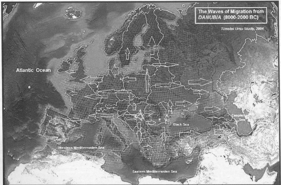
Migrația danubiană (ipoteza T.Ursu, expusă la al V-lea Congres Internațional de Dacologie, București, 2004)

interne. A fost încă un factor care, probabil, a contribuit la uimitoarea lor explozie socială indoeuropeană. Și, firesc, la succesive stocuri de populație excedentară! Dezvoltarea populației peste limita rezonabilă a rezervei de hrană a trebuit să conducă inerent la emigrarea periodică a câte unui segment tribal, întru căutarea altor terenuri, ca noi destinații de sedentarizare. Aceasta e cea mai probabilă explicație a fenomenului valurilor danubiene care – deloc pașnic! - și-au câștigat „colonii” cu habitat independent, întemeind noi neamuri din Peninsula Iberică și până în inima Asiei.